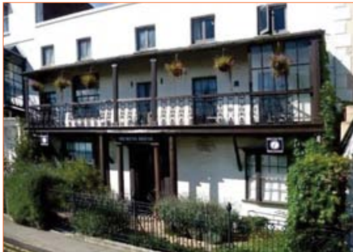
Le musée Charles Dickens, à Broadstairs

Ce voyage sera l'occasion pour les élèves de progresser en anglais, en partageant notamment la vie quotidienne d'une famille. Les élèves, par deux, seront accueillis, logés et nourris durant une semaine chez l'habitant. Pendant la journée, ils seront pris en charge alternativement par les enseignants et animateurs (anglais) de la Kent School of English qui leur dispenseront des cours par groupe de niveau ; puis par les professeurs du collège pour une découverte du patrimoine historique et culturel de cette région de l'Angleterre.