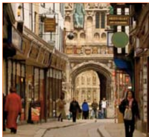
La cité médiévale de Canterbury

Enfin, les élèves passeront une journée à Londres , qu'ils découvriront en bateau-mouche de la Tamise, avant de visiter la City, Westminster, puis de faire librement du shopping dans les quartiers commerçants