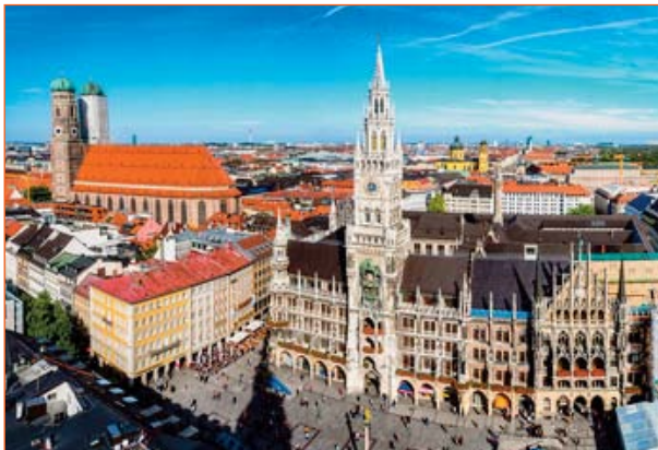
Munich et la cathédrale Notre-Dame

Depuis plusieurs années, notre collège s'est engagé dans une politique d'ouverture vers l'extérieur.