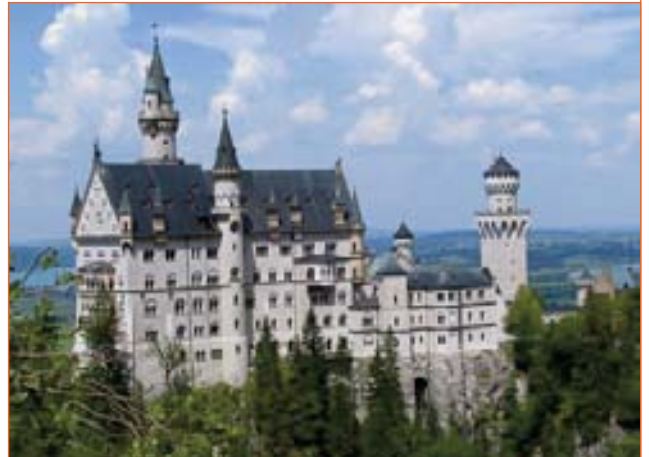
Le château de Neuschwanstein

Les élèves seront hébergés, seul ou par deux, dans des familles munichoises. Ils partageront ainsi la vie de la famille, avec qui ils dîneront, passeront la soirée, et prendront le petit-déjeuner. Ils découvriront le mode de vie à l'allemande, des horaires, des habitudes de vie, une alimentation différente, et devront s'y adapter. Ils auront à interviewer leur famille d'accueil, ce qui leur permettra d'affiner, en situation réelle, leur compréhension et leur expression en allemand.