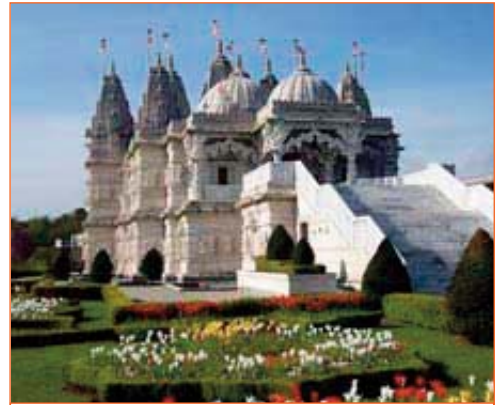
Le Baps Shri Swaminarayan Mandir

Durant le séjour londonien , chacun de ces thèmes sera enrichi et illustré par des visites et activités : visite des quartiers de Londres, visite du British Museum , visite du Science Museum et du Natural History Museum , visite du temple Hindou Baps Shri Swaminarayan Mandir , soirée au Queen's Theatre où ils suivront la comédie musicale « Les Misérables » en anglais.