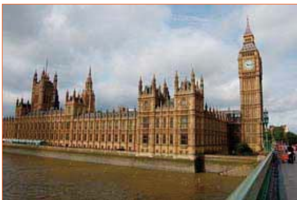
Le Palais de Westminster

Durant les 5 jours à Londres, chaque instant ou activité (visite de la ville, des musées, vie familiale, comédie musicale, shopping...) sera mis à profit par les élèves pour collecter des documents multimédia (imprimé, photo, document audio, film,...) qui seront répertoriés et classés. Ces documents seront utilisés au retour pour créer un carnet de voyage informatisé personnel (b2i).