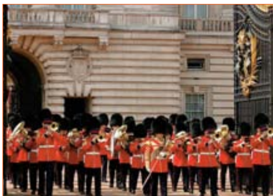
La relève de la Garde, à Buckingham Palace

Depuis l'année scolaire 2008-2009, dans le cadre du jumelage entre Paris et Londres, l'école élémentaire Jules Renard a eu l'opportunité de tisser des liens avec une « Primary School » londonienne : la Hampton Hill Junior School .