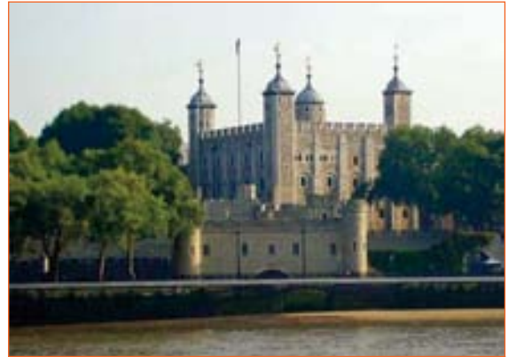
La Tour de Londres, que nous irons voir.

Le voyage permettra aussi de travailler – avant de partir, puis durant le séjour sur place – d'autres compétences : en mathématiques, histoire et géographie, éducation civique. La vie en collectivité, loin du milieu familial, sera l'occasion de vivre l'expérience de l'autonomie, d'accepter l'éloignement parental et le changement des repères habituels. Les élèves seront disponibles pour nouer des relations avec des adultes, en dehors du cadre de l'école. Pour les enseignants, cette vie commune offrira la possibilité de percevoir chaque enfant dans sa globalité, à travers les différents temps de vie.