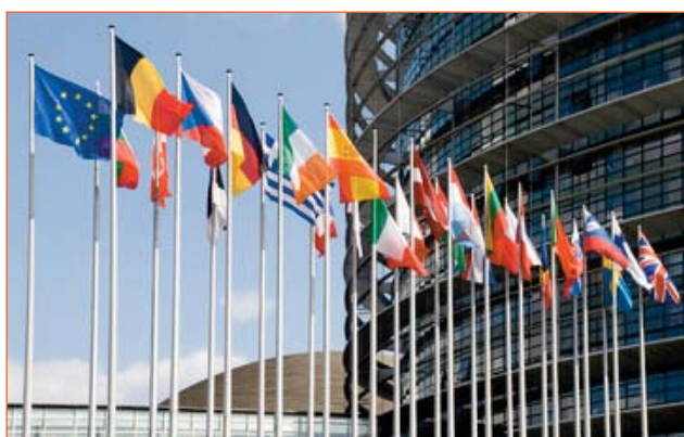
Les drapeaux face au Parlement Européen

Depuis 2005, les élèves anglophones de 4 ème passent chaque année une semaine à Cork. Ils y rencontrent leurs correspondants, et séjournent dans les familles. En 2009, l'équipe éducative a souhaité poursuivre cette démarche en proposant aux élèves de 3 ème un voyage d'étude et de découverte, à Stuttgart pour les germanistes, et dans la région de Barcelone pour les hispanisants. Ces séjours sont depuis renouvelés chaque année.